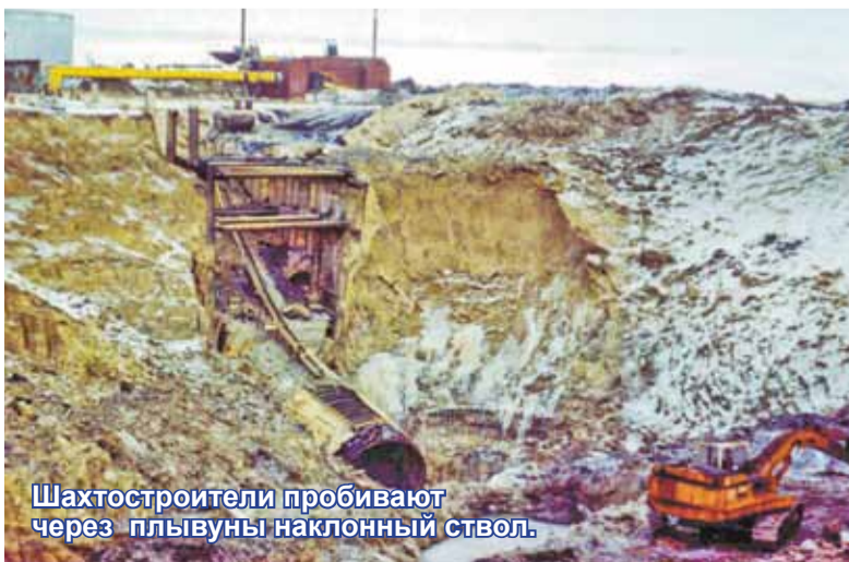
Шахтостроители пробивают через пльвуны наклонный ствол.