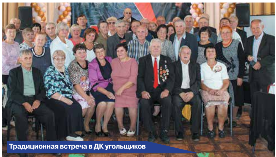
Традиционная встреча в ДК угольщиков