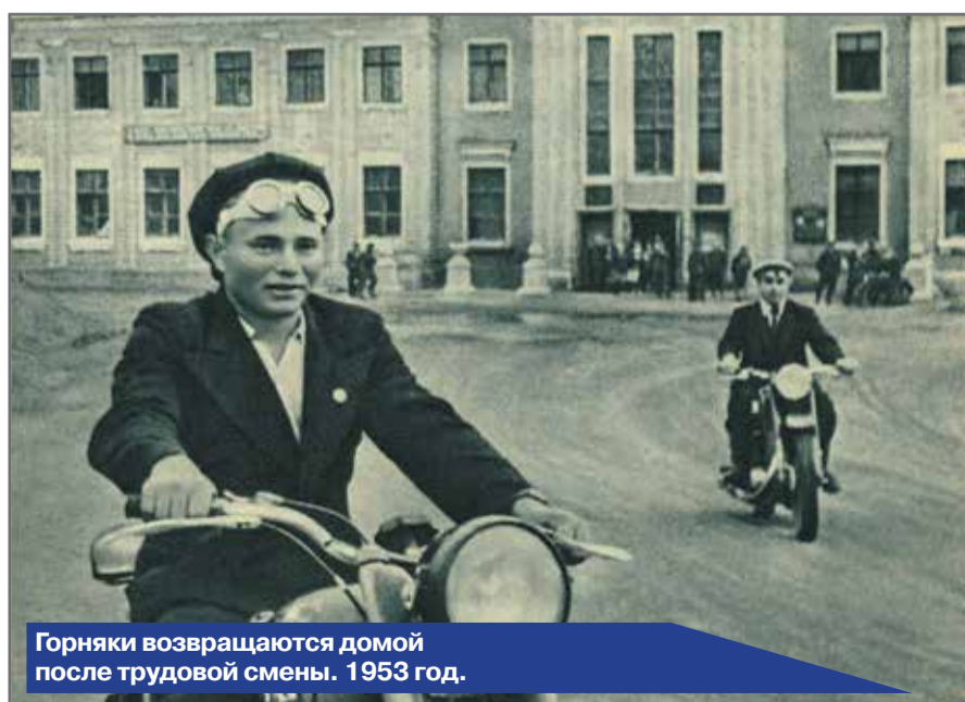
Горняки возвращаются домой после трудовой смены. 1953 год.