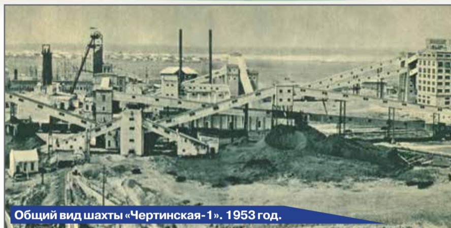
Общий вид шахты «Чертинская-1», 1953 год.