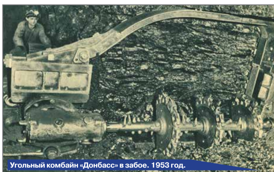
Угольный комбайн «Донбасс» в забое. 1953 год.