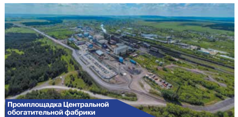
Промплощадка Центральной обогатительной фабрики