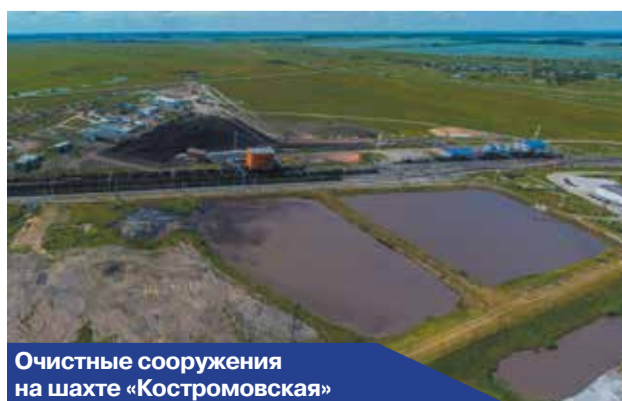
Очистные сооружения на шахте «Костромовская»