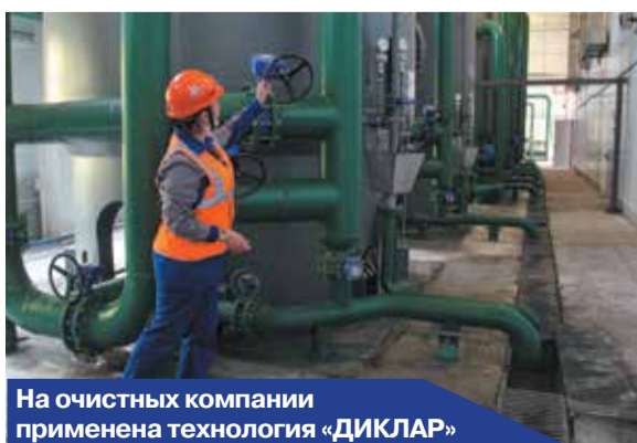
На очистных компания применена технология «ДИКЛАР»

Вкладывая средства в улучшение экологической ситуации, на обучение работников и специалистов по обращению с отходами и экологической безопасности, а значит в комфортные условия для жизни кузбассовцев, компания «ММК-УГОЛЬ» открыто заявляет о своей высокой гражданской ответственности и государственном подходе к ведению бизнеса.