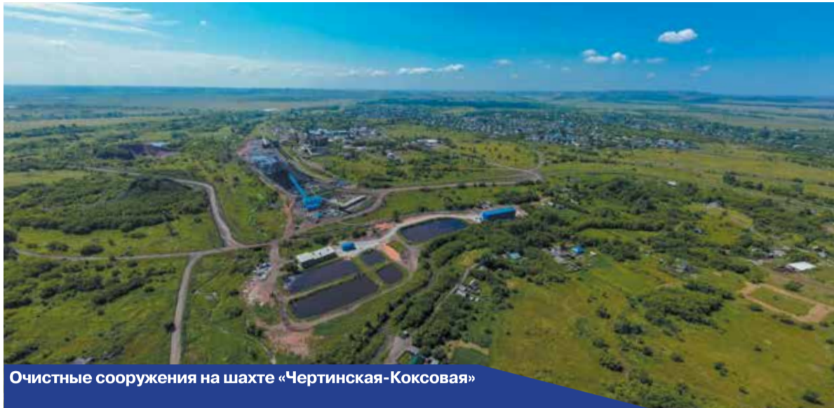
Очистные сооружения на шахте «Чертинская-Коксовая»

Однако компания не стоит на месте. В 2023 году в связи с расширением производства и увеличением водопотока планируется довести мощность очистных сооружений на «Костромов-